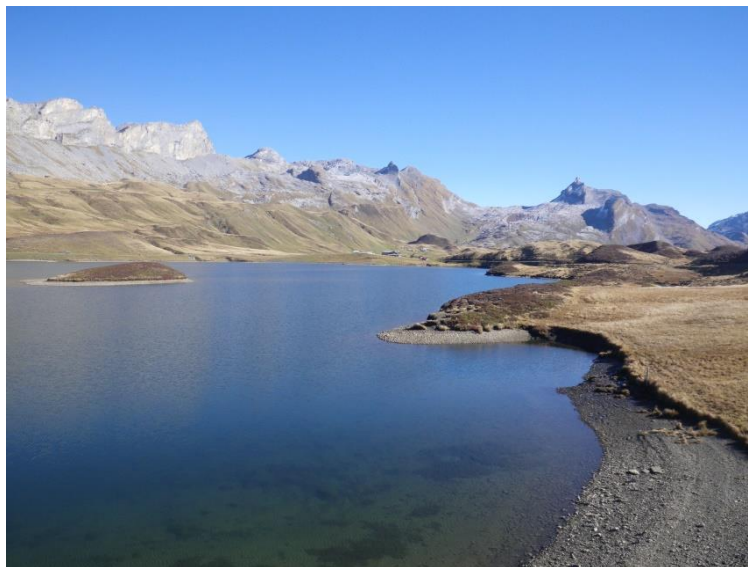
Wunderbare Hochebene mit Tannensee