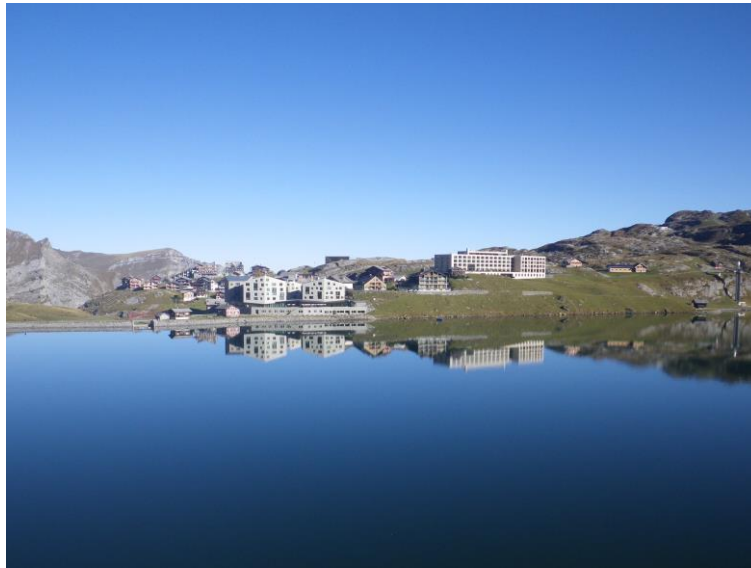
Tiefblauer Melchsee mit Spiegelbild von Melchsee-Frutt