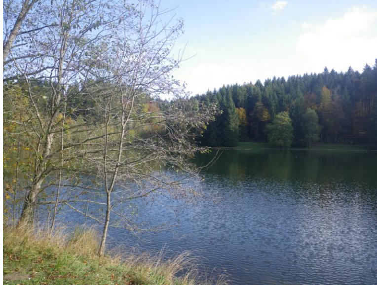
Schöne Sicht auf den idyllischen Teufenbachweiher