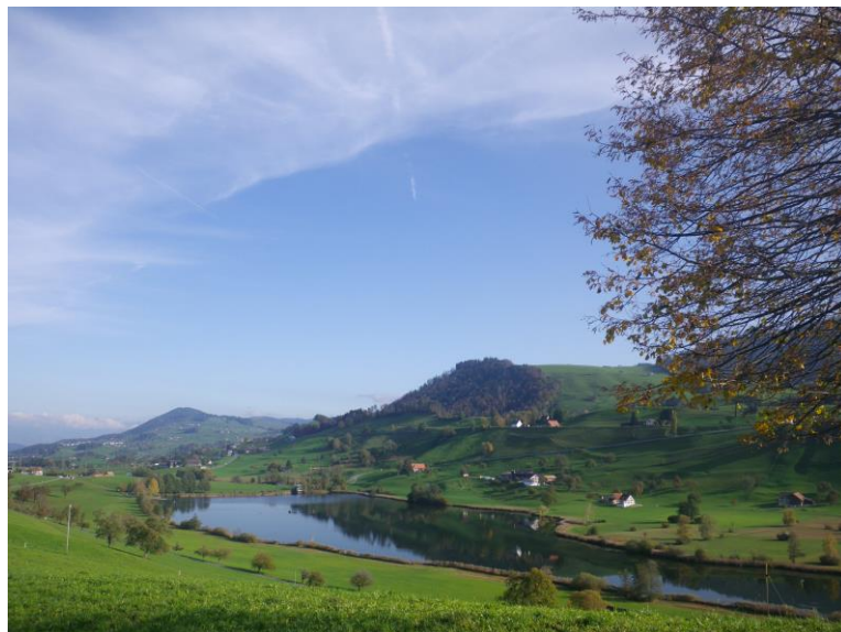
Einladendes Hüttnerseeli mit Sicht zum Etzel